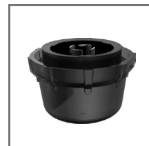
Casambi Ready brezžični modul za Zhaga priključek