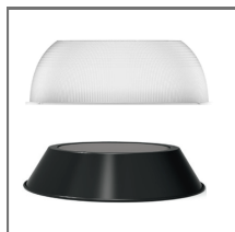
PC / AL reflektor