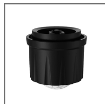
Zhaga senzor gibanja